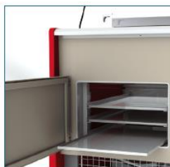
Réserve avec plaques pâtisseries : en option sur modèle statique uniquement