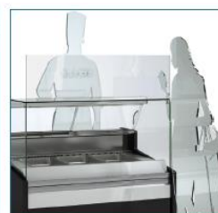
Protection anti-covid (modèles RR uniquement, consulter)