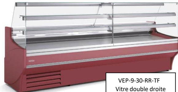
VEP-9-30-RR-TF Vitre double droite Avec froid statique et option décoration totale laquée (FCIBC)

INFOS : Le froid statique est particulièrement adapté en pâtisserie traditionnelle