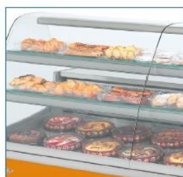
Étagères en verre non réfrigérées